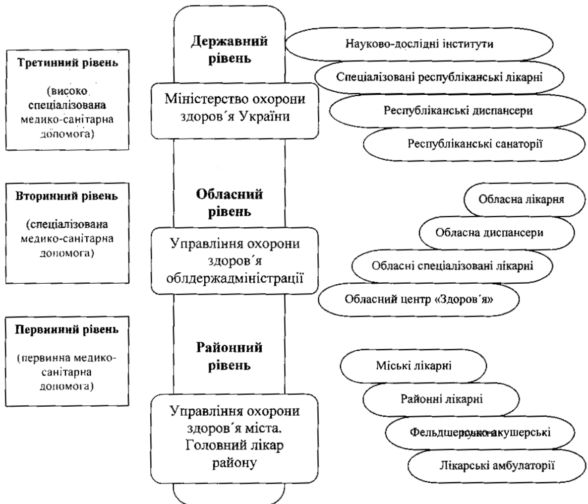
Рис. № 3. Схема системи охорони здоров'я України